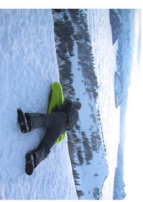
Bremsen: mit Füßen, Board querstellen