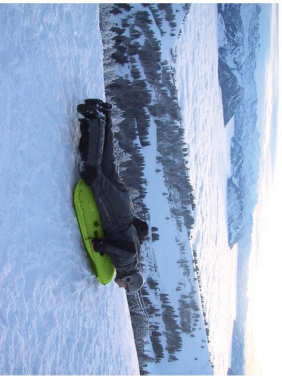
Optimale Position finden