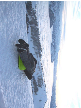
Gewichtsverlagerung für Rechtskurve