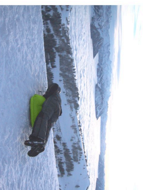
Gewichtsverlagerung für Linkskurve